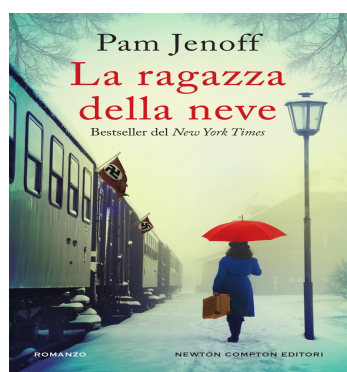
La ragazza della neve

Una raccolta di risposte a quesiti da parte da un autorevole esperto del panorama giuslavoristico italiano, su argomenti "caldi" del mondo del lavoro: dalle novità in materia di incentivi all'occupazione alla tutela delle donne nel periodo protetto, dagli ammortizzatori sociali al licenziamento,