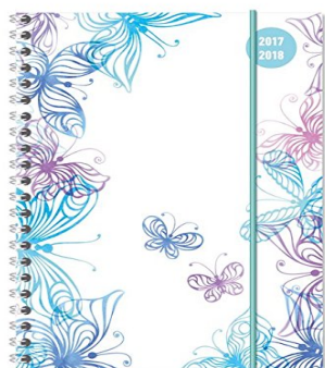
Diario agenda scuola collegetimer „Farfalle“ 2017/2018 - Spiralata - Settimanale - 224 pagine - 15x21 cm