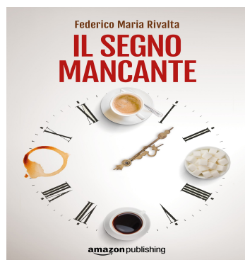
Il segno mancante (Riccardo Ranieri's Series Vol. 3)

Il ritorno del cronista più imprevedibile d'Italia. Riccardo Ranieri è alle prese con un nuovo enigma. Che cosa unisce il rapimento e l'omicidio di due ragazze diciottenni all'uccisione di un gioielliere padovano? Per scoprirlo il giornalista e la sua bellissima compag